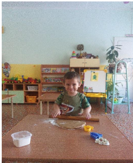
«Рис.5 Раскатывание пласта»