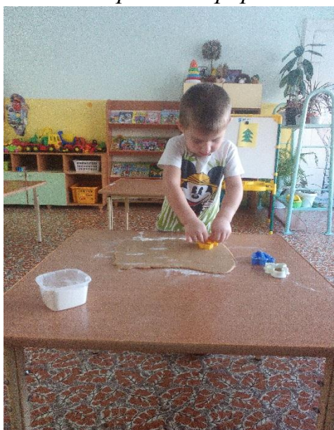
«Рис.6 Вырезание форм»