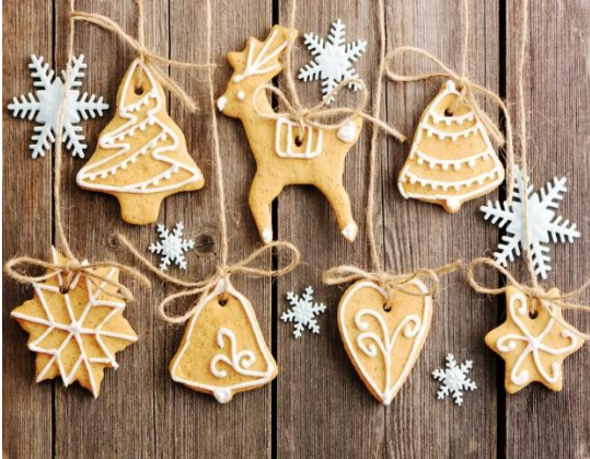
«Рис.2 Пряничные игрушки»