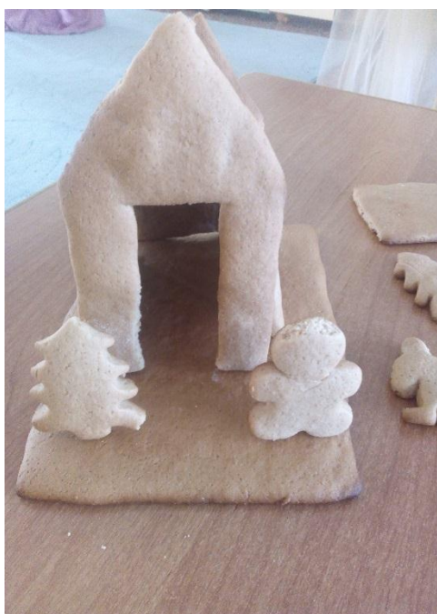
«Рис.12 Построение пряничного дома»