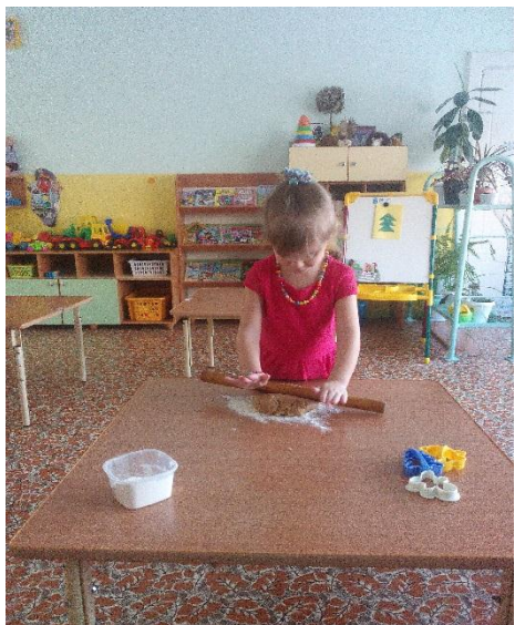
«Рис.4 Раскатывание пласта»