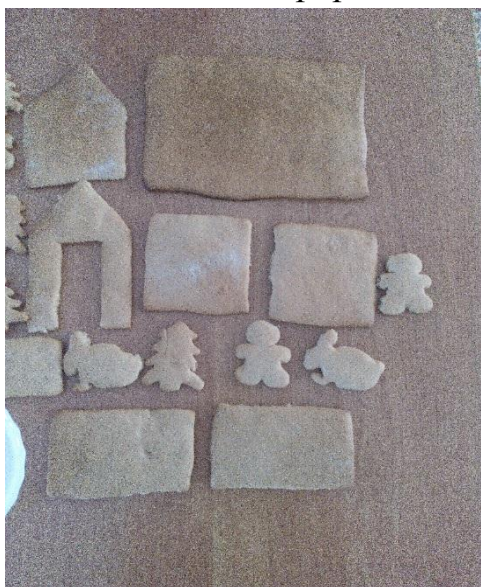
«Рис.10 Готовые формы»