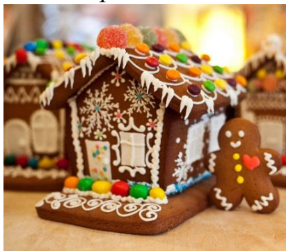
«Рис.3 Пряничный домик»