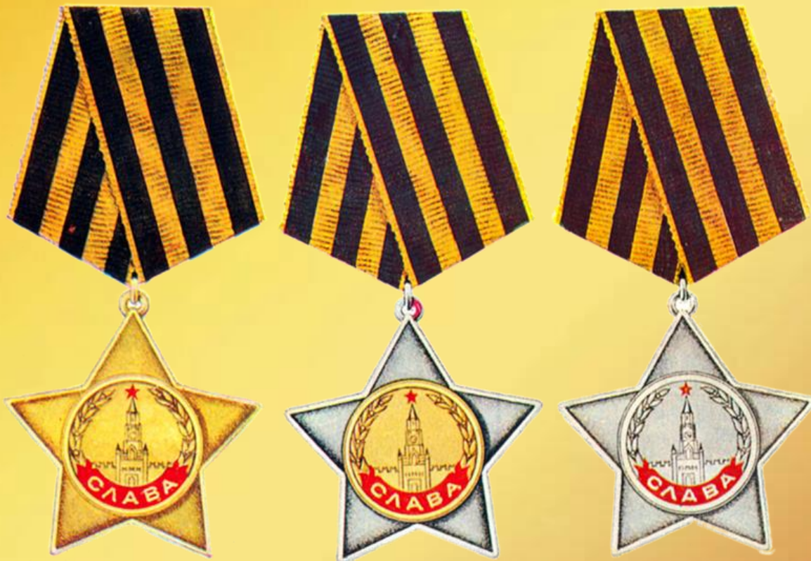
Медаль «За возрождение казачества»