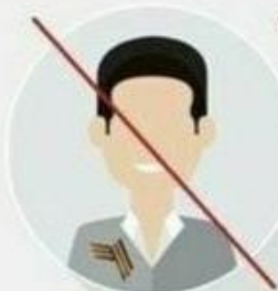
в испорченном виде