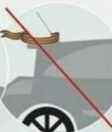
на кузове автомобиля

Помните, ленточка – это не просто кусок ткани. Это символ Победы над фашизмом!